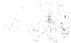
TERESA ESCOBAR JAURE

Los gastos por concepto de estos honorarios deberán imputarse al Subtítulo 21, ítem 04, Asignación 004, "Prestación de Servicios Comunitarios", del presupuesto municipal vigente para el año 2016.-