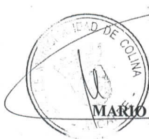
MARIO OLAVARRÍA RODRÍGUEZ ALCALDE I.MUNICIPALIDAD DE COLINA

DUODÉCIMO: El presente instrumento se extiende y suscribe en tres ejemplares, quedando una copia para el artista y las restantes copias a favor de la I. Municipalidad de Colina.