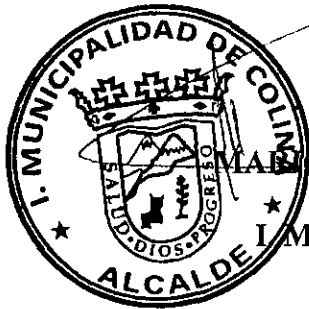
MAURO OLAVARRÍA RODRÍGUEZ ALCALDE I. MUNICIPALIDAD DE COLINA ARRENDATARIA