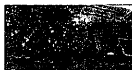
ARTURO PRAT .