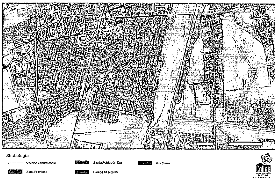
MAPA ZONA PRIORITARIA COMUNA DE COLINA